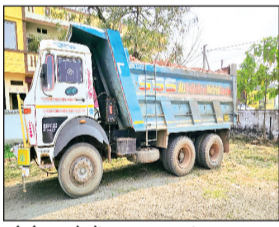
फोटो। थाने में खड़ा जब्त डंपर।

कलेक्टर के निर्देश पर जिले में अवैध खनन और परिवहन के खिलाफ सख्ती बढ़ा दी गई है। इसी कड़ी में रायसेन खनिज विभाग की उडनदस्ता टीम ने भोपाल-विदिशा हाइवे पर अवैध रूप से मुरम का परिवहन करते एक डंपर एम्पी 04 एचई 2734 को जब्त कर पुलिस के सुपुर्द कर दिया है।