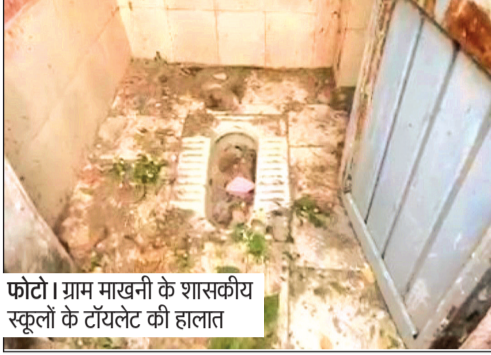
फोटो। ग्राम माखनी के शासकीय स्कूलों के टॉयलेट की हालत

जिले के कई सरकारी स्कूलों में बालिकाओं के लिए बने शौचालय उपयोग के अनुकूल नहीं हैं। कहीं पानी की समुचित व्यवस्था नहीं है तो कहीं दरवाजों की कुंडियां टूटी पड़ी हैं। सफाई और रखरखाव के अभाव में टॉयलेट इस्तेमाल के लायक नहीं बचे हैं। ऐसे में छात्राओं को परेशानी का सामना करना पड़ रहा है। जिला शिक्षा विभाग, जिला शिक्षा केंद्र के आला अधिकारी अब इन्हें क्रियाशील बनाने में जुटे हुए हैं।