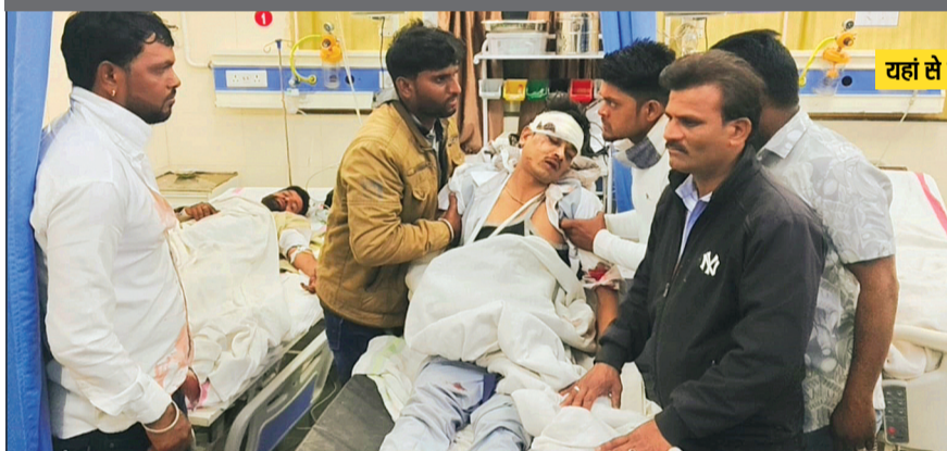
यहां से तालाब में गिरी कार

30 फीट गहरे तालाब में गिरी बारातियों की कार, 7 गंभीर