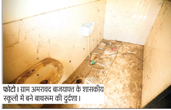
फोटो। ग्राम अमरावद बाजयापत के शासकीय स्कूलों में बने बाथरूम की दुर्दशा।

जिले के ग्रामीण और शहरी क्षेत्रों के प्राथमिक व माध्यमिक विद्यालयों में निरीक्षण के दौरान यह स्थिति सामने आई। कई स्कूलों में टॉयलेटों में पानी नहीं बच रहा, नल खराब हैं और शौचालयों में नियमित सफाई नहीं हो पा रही।